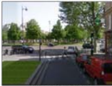
Vista della nuova Etoile, Eco-Boulevard di Bologna