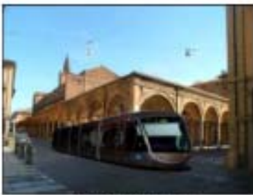
Vista del nuovo tram, centro storico di Bologna