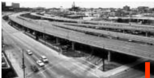
LA VECCHIA TANGENZIALE

Sala Museale del Baraccano | via Santo Stefano 119, 40125 BO