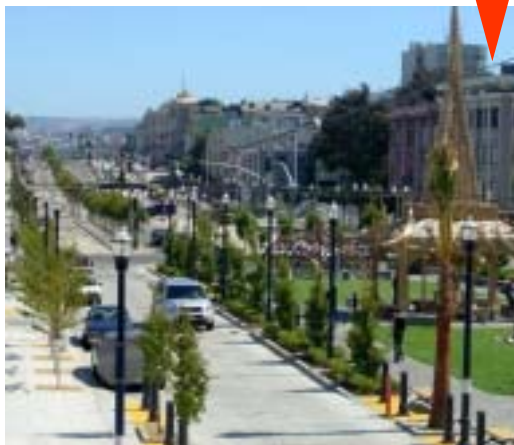
NUOVO ECO-BOULEVARD