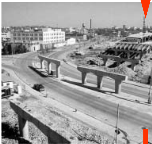
DEMOLIZIONE / RIMOZIONE