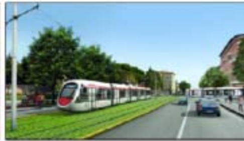
Vista del nuovo Eco-Boulevard di Bologna